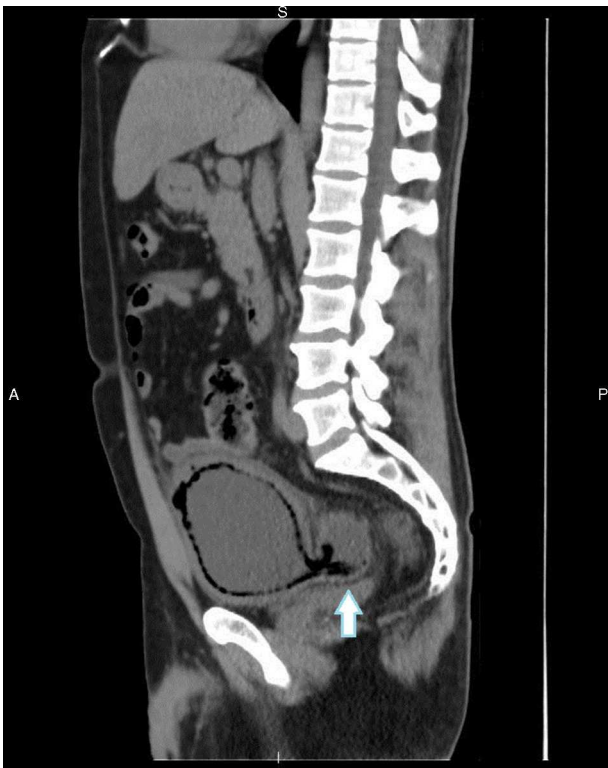
Figura 2 La TCMD de abdomen y pelvis sin contraste oral ni endovenoso, en reconstrucción multiplanar y corte sagital, evidencia un engrosamiento con neumatosis de la pared vesical y un aumento en la densidad de los planos grasos perivesicales. Los cambios se extienden al divertículo (flecha).

pero se sugirió realizar una tomografía computada multi-detector (TCMD) con técnica de urotomografía (uro-TCMD) con contraste endovenoso, una vez implementado el tratamiento y resuelto el episodio agudo, a fin de completar su caracterización.