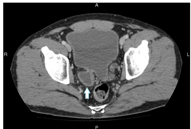
Figura 4 Una vez implementado el tratamiento, la uro-TCMD con contraste endovenoso en plano axial no identificó aire dentro de la vejiga ni en el divertículo (flecha).