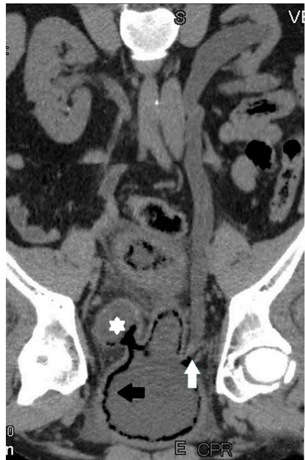
Figura 3 La TCMD de abdomen y pelvis sin contraste endovenoso, en reconstrucción curva desplegando el uréter izquierdo, comprueba gas intravesical (flecha negra) y en el divertículo (asterisco). Además, se aprecia dilatación del uréter y tejido denso en la unión ureterovesical, que ocupa el meato ureteral (flecha blanca).

La cistitis enfisematosa fue identificada por primera vez por Keyes en el año 1882 6 . Se define por la aparición de gas en la pared y, con menor frecuencia, dentro de la luz vesical,