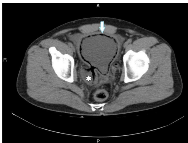
Figura 1 TCMD de abdomen y pelvis sin contraste oral ni endovenoso, corte transversal: se observa gas en la superficie urotelial de la vejiga, que corresponde a una neumatosis parietal (flecha), y un divertículo vesical con gas en sus paredes (asterisco).

Se llevó a cabo una tomografía computada (TC) de abdomen y pelvis sin contraste oral ni endovenoso, debido al antecedente de cólico y litiasis. El estudio mostró engrosamiento difuso de la pared vesical con alteración de los planos grasos perivesicales y presencia de aire en relación con la superficie interna de la pared vesical. Se identificaron formaciones diverticulares englobando la desembocadura de ambos uréteres y burbujas de gas a nivel parietal (figs. 1 y 2). También se detectó uronefrosis bilateral, más evidente en el lado izquierdo, y en la desembocadura del uréter izquierdo se identificó tejido isodenso. Este se interpretó como secundario al proceso inflamatorio (fig. 3),