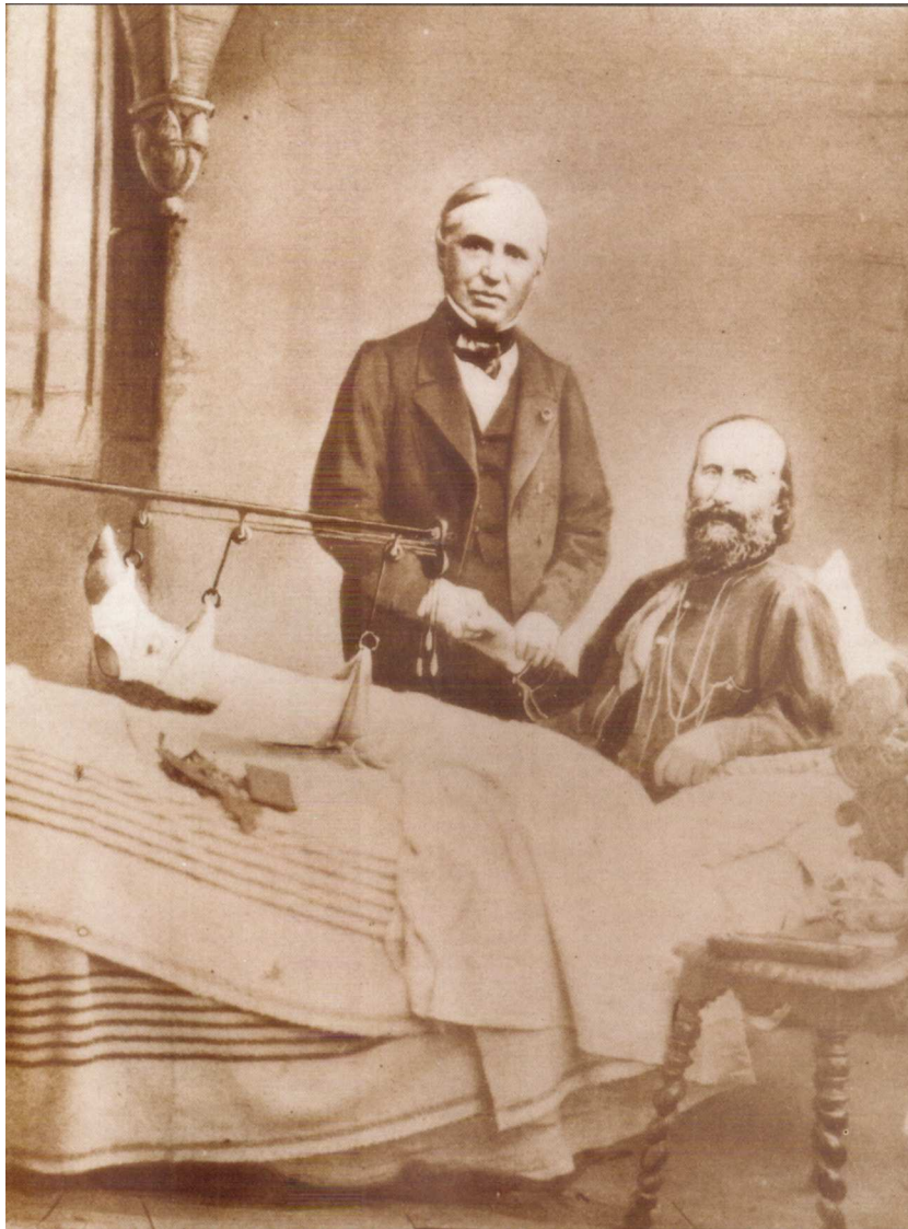
Figura 3 Retrato de Auguste Nélaton y Giuseppe Garibaldi estrechando manos (nótese que el cirujano francés está comprobando con su mano izquierda el pulso arterial de su paciente). Garibaldi, herido y tendido en la cama, acaba de recibir la noticia de que su pierna no será amputada.