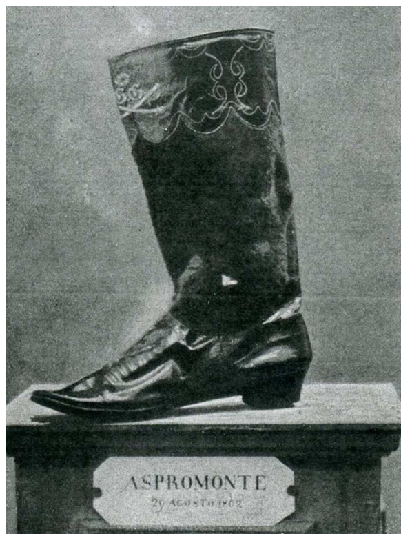
Figura 2 La bota que usó Garibaldi en Aspromonte, con el orificio de entrada de la bala (Museo Cívico del Risorgimento di Bologna).

septiembre marchó hacia la prisión de Varignano para dar su opinión sobre la herida. Una vez recibido cortésmente por los asistentes médicos de Garibaldi, examinó al paciente y explicó que la bala no se hallaba en la articulación ni estaba alojada en otro lugar. Aún así, algunos médicos italianos seguían sosteniendo que esta se encontraba en el tobillo. La lesión, mientras tanto, no mejoraba y, dada su gravedad, un cirujano vienés hasta planteó la posibilidad de una amputación 2-4 .