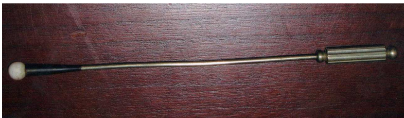
Figura 4 La sonda de Nélaton.

bien entrado el siglo XX se lo consideraba parte esencial del equipo de los cirujanos militares o navales. Incluso, llegó a usarse en el presidente norteamericano Abraham Lincoln para ubicar la bala que estaba alojada detrás de su órbita luego del atentado que acabó con su vida el 14 de abril de 1865 6 .