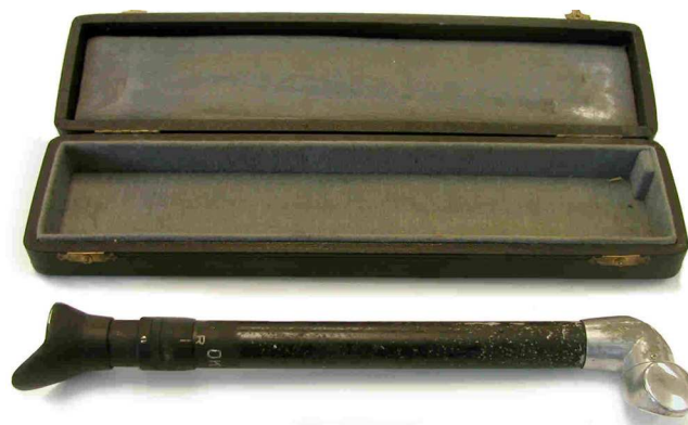
Figura 1 Fluoroscopio intraoral.

El objetivo de los fluoroscopios orales era proporcionar un dispositivo adaptado que permitiese al profesional observar con seguridad y de forma instantánea las condiciones normales y patológicas de las estructuras de los arcos dentales y de las adyacentes a los tejidos blandos, que tienen