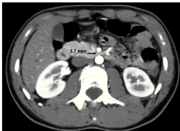
Figura 1 Tomografía computada con contraste endovenoso de la paciente: se muestran los cortes axiales en fase arterial. La medición de la distancia aorta-arteria mesentérica superior se encuentra disminuida (3,7 mm).

Hay una serie de elementos que predisponen el desarrollo de este síndrome: condiciones asociadas a la pérdida severa de peso (cáncer, sida, parálisis cerebral o abuso de