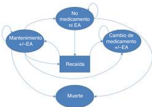
Figura 1 – Modelo.

Entre los demás antipsicóticos, el más efectivo fue el aripiprazol con 2,60 años antes de modificar el tratamiento, sin embargo su razón de costo efectividad incremental frente a la siguiente alternativa en términos de efectividad, el haloperidol, fue de $606.069.242, muy superior a tres veces el producto interno bruto (PIB) per cápita ($14.287.805) 51 . Con excepción del aripiprazol, el haloperidol reportó mayor efectividad y menores costos frente a los demás antipsicóticos que no están en el grupo de primera línea (tabla 1).