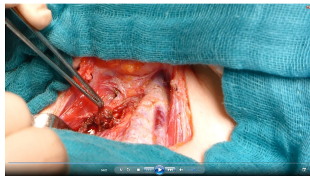
Figura 4 Resección de glándula paratiroides izquierda.

La PTH intraoperatoria muestra un descenso progresivo. En el postoperatorio inmediato: la paciente requiere calcio por vía intravenosa. Al quinto día postoperatorio es dada de alta, con aporte de calcio y vitamina D por vía oral. A