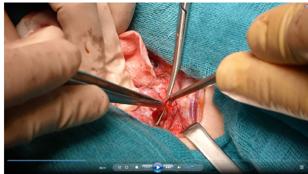
Figura 3 Paratiroidectomía subtotal derecha.