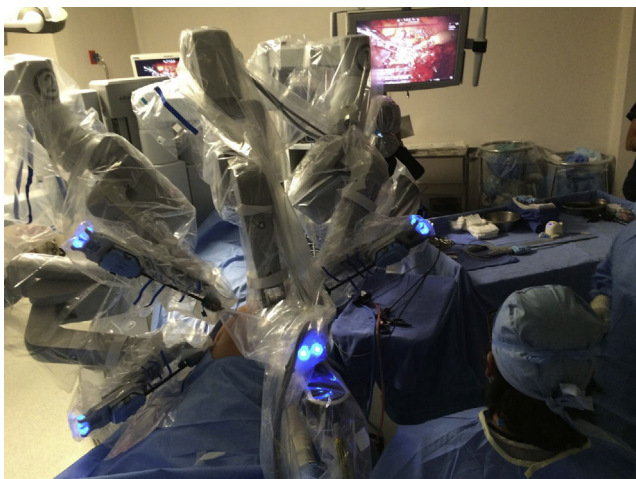
Figura 1 Brazos robóticos posteriormente al docking .