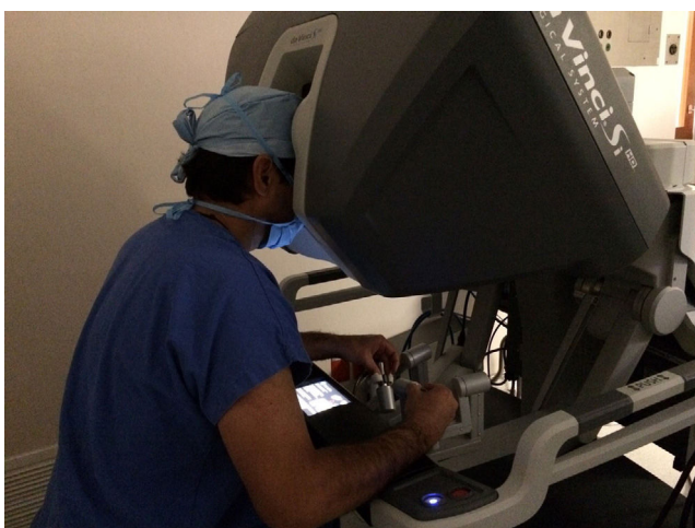
Figura 2 Consola del cirujano.

cirugía laparoscópica asistida con robot en cirugía colorrectal, el papel de esta técnica continúa en desarrollo 3 . Al igual que nosotros, diversos autores a nivel mundial reportan su experiencia y resultados iniciales desde hace varios años 3-9 (tablas 1 y 2).