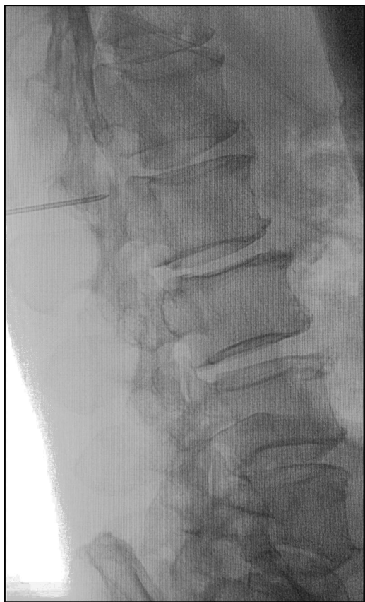
Figura 3 Imagen fluoroscópica transoperatoria lateral de L1-L2 durante la punción evacuadora del quiste.