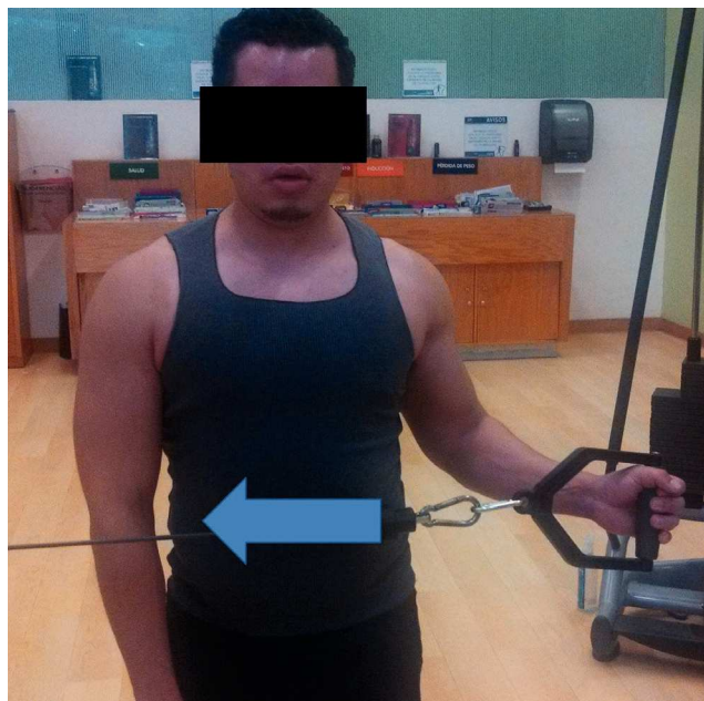
Figura 4 Ejercicio excéntrico para rotadores internos con uso de polea en plano neutro.

caciones, se decidió incluir el análisis de los 4 artículos en este reporte. Las características generales de los estudios se muestran en la tabla 1.