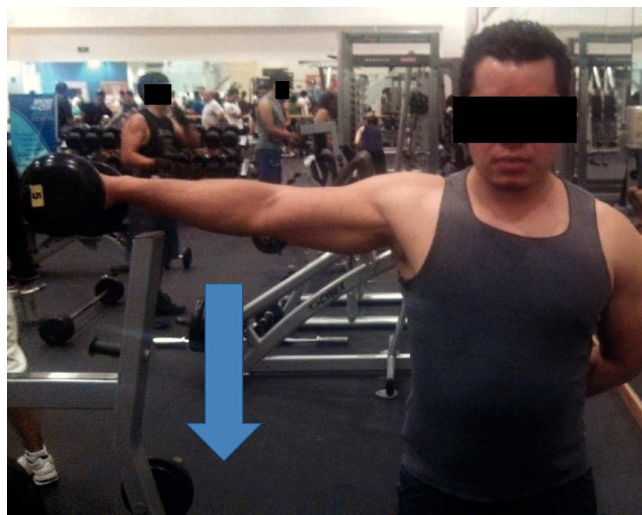
Figura 1 Ejercicio por contracción excéntrica para deltoides medio con uso de mancuernas; el movimiento concéntrico implica abducción de hombro; una vez abducido, se inicia la contracción excéntrica lenta acercando el brazo al tronco.

Langberg et al. 19 reportaron que existe un aumento de la síntesis de colágeno en tendones dañados como resultado de un programa de entrenamiento excéntrico durante 12 semanas y un incremento en la concentración de colágeno peritendinosa tipo I, que se correlacionó clínicamente con disminución de los niveles de dolor; dicho hallazgo no se encontró en tendones sanos.