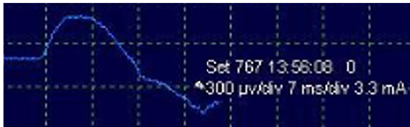
Figura 3 – Potencial de acción muscular compuesto de nervio frénico izquierdo tras estímulo en punto proximal cervical mediante sonda monopolar. Morfología bifásica, latencia (al inicio de la fase negativa): 6,8 ms; amplitud: 524 \mu V.

en detectar cambios neurofisiológicos significativos (disminución en > 50\% de amplitud y/o aumento de > 10\% de la latencia del PAMC basal), correlacionarlos con las maniobras quirúrgicas de riesgo que han podido producirlos y alertar al cirujano en ese caso, quien tomará las precauciones oportunas en un intento de revertirlos para minimizar, así, la posibilidad de déficit neurológico postoperatorio. Si se detectase interrupción en la transmisión del estímulo a lo largo de la vía nerviosa, lográndose desencadenar un PAMC con estímulo más distal (indicativo de lesión segmentaria), sería posible mediante mapeo, desde niveles distales hacia proximales, localizar el punto exacto de la lesión con el fin de intentar su reparación en caso de apreciarse solución de continuidad en dicho punto.