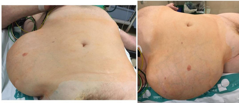
Figura 1 – Eventración lumbar: exploración física.