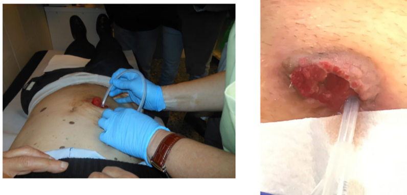
Figura 2 – Canulación del asa eferente de la ileostomía.

media de 4 días (frente a los 10 de ingreso de los controles de la serie retrospectiva).