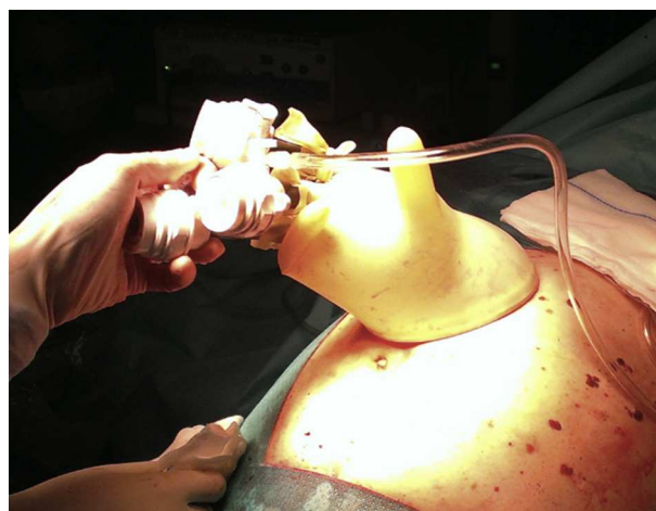
Figura 1 – Dispositivo «glove port».

En la ECOI realizada a través del retractor de piel, identificamos una metástasis hepática en el segmento 2-3 de 10 cm de diámetro, y una cicatriz de aspecto maligno en el lecho de antigua resección en el segmento 4 b. A través de esta única incisión, realizamos también una palpación del parénquima hepático.