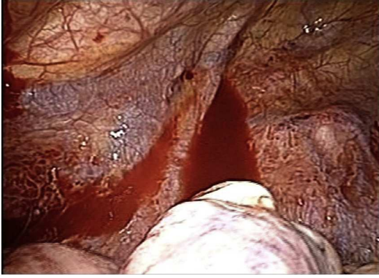
Figura 2 – Toracoscopia exploradora donde se evidencian ampollas a nivel de ápex izquierdo.

de bilateralidad del mismo, de recidiva y de fuga aérea persistente 5 .