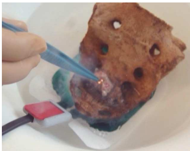
Figura 2 – Electrocoagulación indirecta in vitro.

En todos los pacientes en los que se empleó este método para el control de la hemorragia presacra el resultado fue satisfactorio (tabla 1). En un paciente, el taponamiento con compresas durante 48 horas había resultado ineficaz y en otro el sangrado continuaba a pesar de la aplicación de taponamiento, Surgicel® y Floseal®. En otro paciente, tras intervención de Hartmann, presentó un hematoma pélvico y sangrado transrectal. La hemorragia persistía tras dos intentos fallidos de taponamiento pélvico y empleo de Surgicel® y Floseal®. En los 4 pacientes restantes se empleó como primera elección. En 1 paciente hubo que utilizar 2 fragmentos musculares por no cesar definitivamente el sangrado y 4 fragmentos en otro paciente por la existencia de varios focos de sangrado. En 3 casos el músculo quedó firmemente adherido a la superficie ósea y fue dejado en su lugar y en los restantes fue removido sin que se objetivase hemorragia.