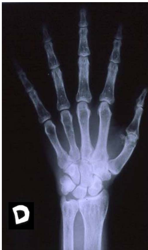
Figura 1 - Radiografía de la mano derecha.

de desmineralización ósea en las radiografías realizadas (fig. 1). Se practicó una nueva exploración cervical unilateral con exéresis de la masa y biopsia de la glándula paratiroides inferior derecha. El patólogo en su informe concluyó que se trataba de un adenoma quístico necrosado (5 × 5,5 × 3,5 cm y 42 g de peso), sin demostrarse alteraciones relevantes en la paratiroides biopsiada. En 1995 le fue diagnosticado incidentalmente un carcinoma renal de células granulares de tipo oncocítico. Tras la nefrectomía sufrió un empeoramiento progresivo de la función renal. En el año 1996 se realizó exéresis de una tumoración ósea mandibular. En ese momento presentaba una calcemia de 10,6 mg/dl, fósforo de 3,4 mg/dl y PTH de 1.144 pg/ml. La creatinina era de 4 mg/dl en relación con nefropatía intersticial hipercalcémica y riñón único. En 1997, una gammagrafía con tecnecio-sestamibi reveló un posible adenoma paratiroideo en proximidad al tercio inferior del lóbulo tiroideo derecho (fig. 2). Realizamos una resección selectiva, siendo el diagnóstico de hiperplasia nodular de células principales (1,65 g). Tras la intervención quirúrgica, el paciente presentó un síndrome de «hueso hambriento» que requirió la administración de altas dosis de calcio y calcitriol. En los años siguientes su función renal se deterioró progresivamente, y falleció en enero de 2003 como consecuencia de una insuficiencia renal y un absceso en el quiasma óptico de etiología desconocida.