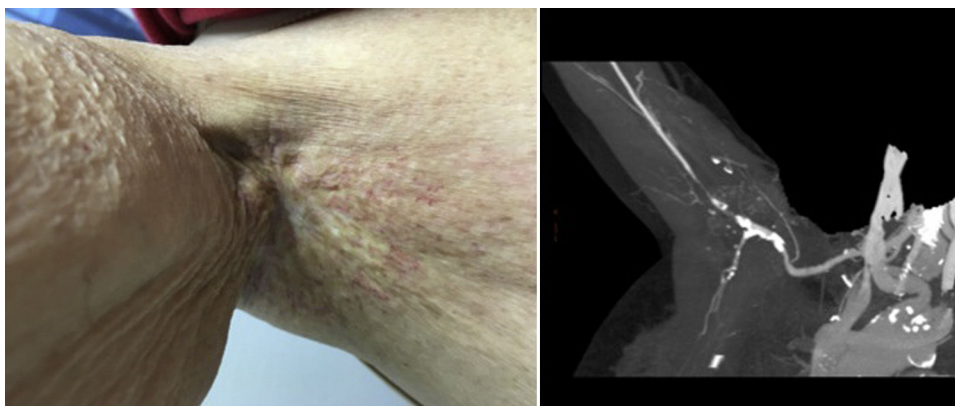
Figura 1 Imagen de la región axilar de la paciente, se observa la dermatitis r dica de la misma y del angio-TC diagn stico, donde se confirma la estenosis de la arteria axilar proximal y la oclusi n distal y zona proximal de la humeral.

los 42 a os posteriores a la exposici n 2,4 , como en nuestro caso, donde los s ntomas isqu micos se iniciaron 60 a os m s tarde.