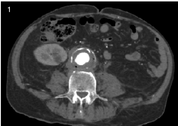
Figura 1 TAC abdominal con contraste intravenoso en fase arterial. Se observa aneurisma de aorta abdominal infrarrenal de diámetro máximo de 48 mm, trombo mural circunferencial en su interior, con múltiples burbujas de gas en su pared, compatible con aneurisma micótico. Puede visualizarse colección retroaórtica laminar con densidad de partes blandas, sin plano de separación con trombo mural, ni con los cuerpos vertebrales, en relación con colección.

se decide seguimiento estrecho sin tratamiento antibiótico empírico a largo plazo, debido a la normalización de los parámetros analíticos y a la esterilidad de los cultivos microbiológicos.