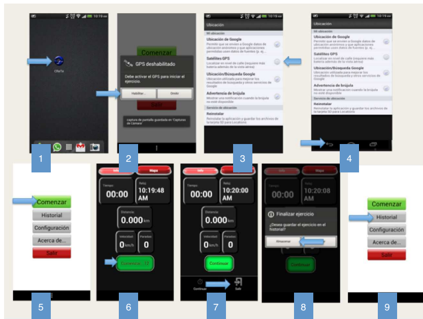
Figura 1 Tras pulsar sobre el icono de la aplicación CRETe (1), aparece la pantalla inicial (2). Si el usuario tiene desactivado el sistema de localización por GPS en su dispositivo, salta un mensaje indicando que debe habilitarlo (2). Una vez habilitado (3 y 4) se vuelve a la pantalla de inicio (5) y se pulsa sobre «Comenzar». Esto lanza un servicio Android que se ejecuta en segundo plano y que tiene asociado una interfaz (6). Una vez el usuario finaliza el ejercicio de rehabilitación, pulsa el botón «Salir» (7) y si desea guardar la sesión pulsa sobre «Almacenar» (8). Eso enviará una petición post al servidor que procesará y almacenará la información de la sesión en la BD MySQL. Además responderá al dispositivo y el usuario podrá ver sus prácticas en el botón «Historial» (9).

para plataforma Android (registrada ante notario), que envía los datos de ejercicio físico a una base de datos vía Internet.