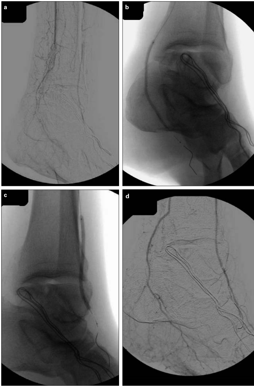
Figura 3. a) Obstrucciones a nivel maleolar de la arteria tibial posterior y tibial anterior; b) Angioplastia de la arteria tibial posterior con catéter-balón de 2,5 x 120 mm; c) Angioplastia de la arteria tibial anterior; d) Resultado final.

nes (4%) y ningún fallecimiento relacionados con el procedimiento que hemos obtenido.