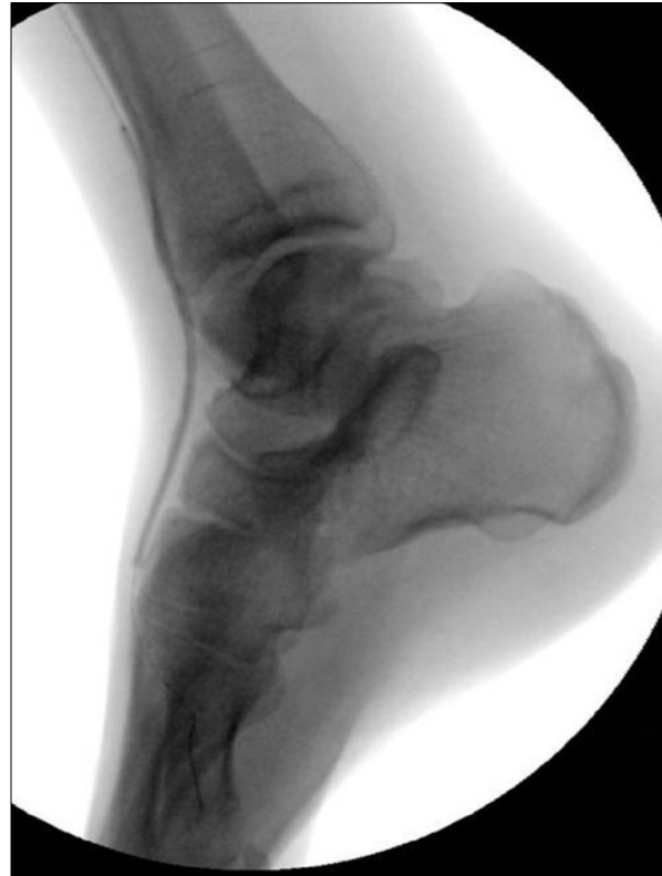
Figura 2. Angioplastia de la arteria tibial anterior con catéter-balón de 2 x 120 mm.

El éxito técnico inicial es fundamental en los procedimientos endovasculares, la imposibilidad de recanalizar la lesión significa un fracaso inmediato: en nuestros pacientes el éxito técnico inicial fue del 86%, similar al registrado en otras series [12]. Las lesiones que tratamos eran, en su mayor parte, obstrucciones o series de estenosis extensas, con una media de 7 cm de longitud, localizadas en varios casos a nivel maleolar, lo que da una idea de la complejidad de éstas. La tasa de salvamento de la extremidad que presentamos es comparable a las obtenidas en otras series dada la extensión de las lesiones arteriales tratadas. Romiti et al [12], en un metaanálisis publicado en 2008, informaron de una tasa de salvamento de la extremidad del 86% a los doce meses para la ATP distal, similar al 88,5% del bypass distal con vena safena. Aunque las tasas de permeabilidad de la ATP son inferiores a las del bypass distal, las tasas de salvamento de la extremidad son similares. Esto parece deberse a que si la durabilidad del procedimiento es suficiente para el cierre de las lesiones, un fracaso hemodinámico en el tiempo no conlleva necesariamente una reaparición de las lesiones. Es decir, una reestenosis morfológica no significa una reestenosis clínica.