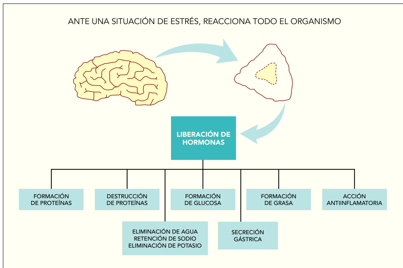
Fig. 1. El organismo y el estrés.

mientras que si es muy intenso, descompensa al sujeto (puede incluso llegar a causarle la muerte).