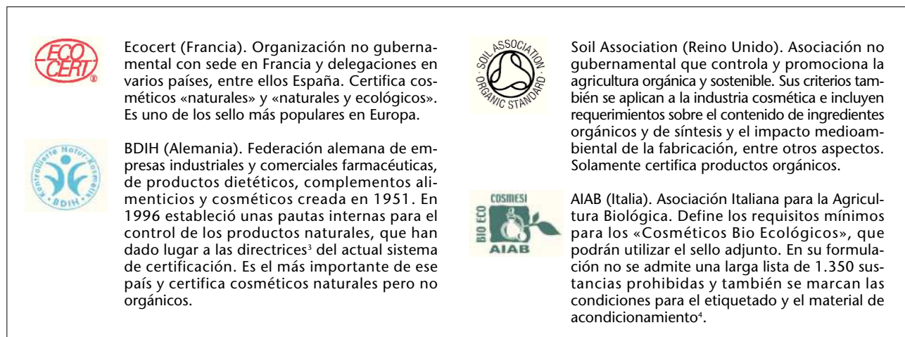
Fig. 1. Principales sellos de certificación de cosméticos en Europa.

Cada organismo certificador tiene establecidos sus propios criterios de exigencia para los productos cosméticos y en consecuencia, algunos organismos tienen criterios más estrictos que otros. Un cosmético certificado muestra en su material de acondicionamiento el sello o logo del organismo certificador. Es posible obtener más de una certificación, y por tanto, varios sellos pueden aparecer en el mismo cosmético (fig. 1).