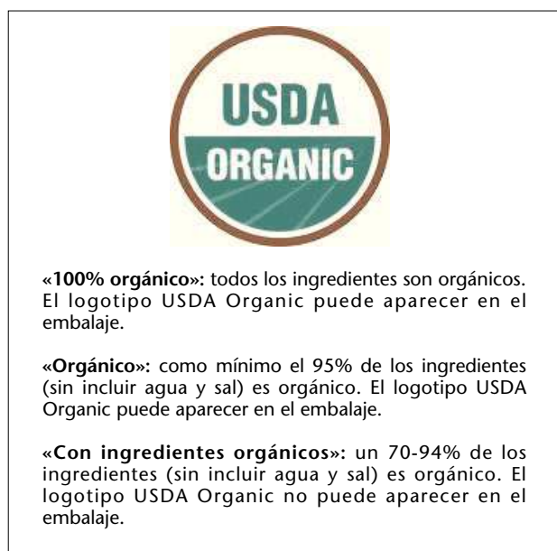
Fig. 2. Condiciones de aparición del logotipo USDA Organic.

Ecocert es un organismo que desarrolla operaciones de control y certificación en 85 países del mundo, con