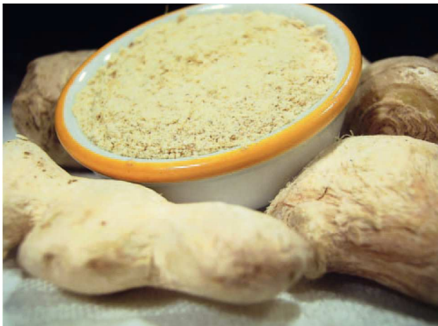
Fig. 6: El jengibre en polvo o desecado calienta y refuerza el Yang