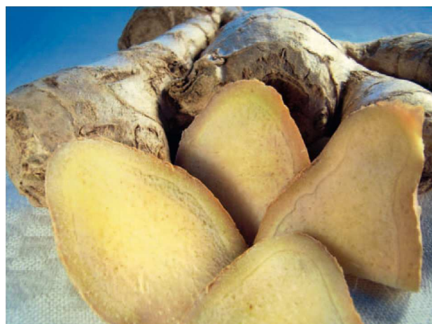
Fig. 5: El jengibre es eficaz contra los trastornos dispépticos y las náuseas

En la monografía se describen los siguientes efectos del jengibre: evita las náuseas y vómitos, aumenta la fuerza de contracción del miocardio, fomenta la secreción de saliva y jugos gástricos, actúa como colágeno y estimula el peristaltismo intestinal. Contraindicación: en casos de cálculos biliares sólo debe emplearse previa consulta con un médico. Observación: no debe utilizarse para las náuseas del embarazo 5 . Se han descrito algunos casos en los que tras la ingestión de preparados de jengibre en dosis elevadas aumentó el riesgo de hemorragia por disminución de la síntesis de tromboxano, cuando se administraban simultáneamente inhibidores de la agregación plaquetaria y