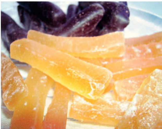
Fig. 8: El jengibre confitado refuerza el bazo y el pulmón con su sabor dulce y picante