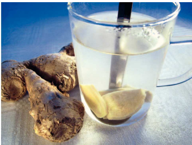
Fig. 7: El especiado té de jengibre dispersa el frío y calienta por dentro