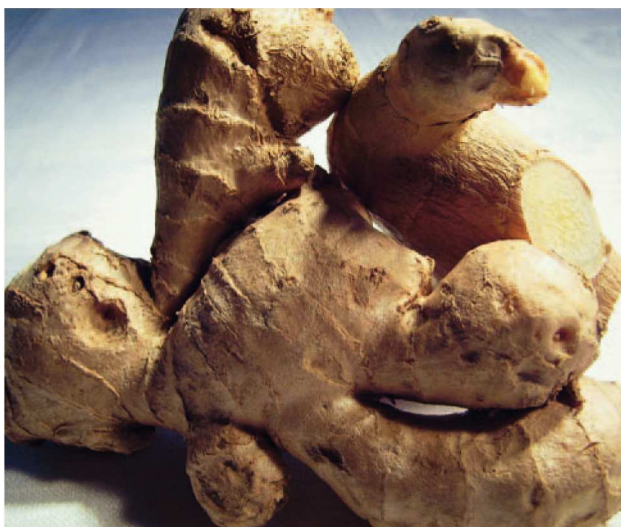
Fig. 1: El rizoma de jengibre crece bajo tierra y presenta unas tuberósidades características

El jengibre ( Zingiber officinale Rosc., shengjiang) es una especia y planta medicinal utilizada desde antiguo procedente de Asia Central y el Sudeste Asiático. Esta planta con rizoma de la familia de las zingiberáceas, similar a un lirio, se cultiva en todas las regiones tropicales y subtropicales de Asia, en partes de África, en Brasil y Jamaica 1 . En la actualidad, casi el 50% de la cosecha mundial procede de la India. El jengibre se da en toda China, pero especialmente en las regiones centrales y meridionales 2 . El jengibre es una planta vivaz resistente con un vigoroso rizoma rastrero horizontal que presenta tuberósidades y ramificaciones (fig. 1). Del rizoma surgen falsos tallos y brotes con flores. El nombre del jengibre procede del sánscrito shringavera , que quiere decir “con forma de cornamenta”. De allí se derivaron el griego ziggiberis , el latín zingiber y el inglés ginger . Los rizomas, utilizados para fines terapéuticos y alimenticios, se recogen entre 9 y 10 meses después de la plantación. Después de lavarse bien, el jengibre se deja secar algunos días al sol. De toda la planta sólo se utilizan las «manos» del rizoma, de unos 10 cm de longitud. Los rizomas jóvenes se utilizan frescos, mientras que los más viejos se secan y presentan un sabor mucho más fuerte. El jengibre posee un característico aroma perfumado y refrescante con un toque de limón. Su sabor es especiado, picante y penetrante, con un toque ligeramente dulzón.