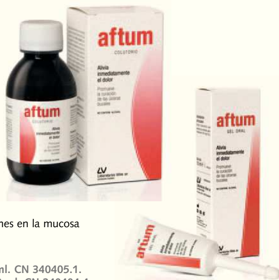
Presentación - Aftum Gel Oral. Envase de 15 ml. CN 340405.1. - Aftum Colutorio. Envase de 150 ml. CN 340404.4

Aftum Colutorio permite una aplicación homogénea por toda la cavidad bucal en forma de enjuague. Resulta especialmente adecuado para prevenir la aparición de úlceras recurrentes, en el tratamiento de pequeñas úlceras o lesiones en la mucosa oral y en las asociadas al uso de prótesis, ortodoncias, etc.