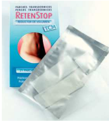
Presentación - Retenstop. Envase de 21 parches.

Interviene sobre la retención de líquidos típica de la mujer, que produce el llamado vientre hinchado. Está formulados a base de laminaria —rica en yodo— y té verde, para transportar los activos directamente a la sangre. Los efectos de Retenstop son progresivos y han de mantenerse, como mínimo, durante todo un mes. Se recomienda su uso en combinación con una dieta ligera y equilibrada, con la práctica de deporte de forma regular y con la ingesta de 1,5 litros de agua al día.