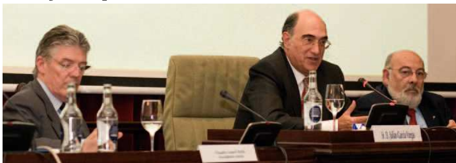
El ex ministro de Sanidad, Julián García Vargas (en el centro), asistió a la Asamblea.