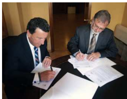
El convenio ha entrado en vigor este mes de mayo.

«El Colegio de Farmacéuticos posee la infraestructura y el personal técnico necesario para cubrir la demanda de análisis microbiológicos que requieren