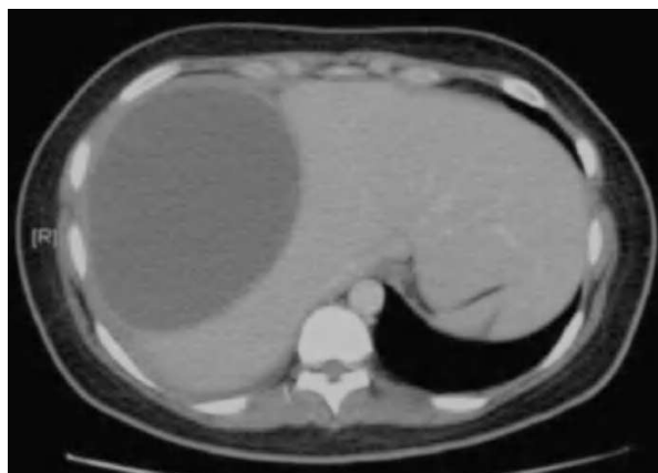
Fig. 2. Hematoma subcapsular hepático organizado.

Nuevamente se decidió un tratamiento expectante tras la obtención de hemocultivos negativos y cultivo de material obtenido por punción-aspiración del hematoma, también negativos.