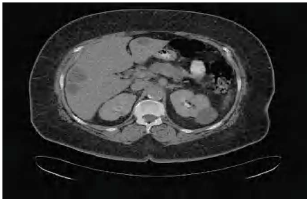
Fig. 1. Tomografía computarizada abdominal: Se observan varias lesiones hipodensas redondeadas en ambos lóbulos hepáticos correspondientes a abscesos por Gemella morbillorum .

mitos. Asimismo, refiere una intensa astenia y una pérdida de 10 kg de peso en los últimos meses, sin hiporexia; en la anamnesis no presenta otros datos de interés ni signos de focalidad infecciosa. En la exploración, la paciente presenta una estabilidad hemodinámica y una temperatura de 36,4 °C. Presenta un estado general regular, palidez de piel y mucosas y deshidratación. En la auscultación cardíaca se detecta un ritmo con soplo sistólico en el foco aórtico III/VI. El abdomen era doloroso tras la palpación profunda del hipocondrio y la fosa ilíaca derecha, sin signos de irritación peritoneal. Presenta una hepatomegalia de 4 cm. En el resto de la exploración no se detectaron signos patológicos.