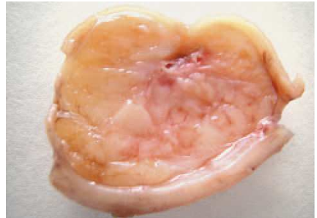
Fig. 2. En la imagen se visualiza claramente un tumor de unos 50 mm de diámetro mayor, de coloración blanquecina, consistencia firme y con una gran ulceración en la superficie. La integridad de la capa muscular propia se puede aventurar ya en el examen macroscópico.