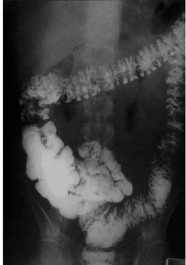
Fig. 2. Enema opaco con imágenes nodulares en todo el marco cólico, de predominio en el colon descendente y el sigma.

Los pólipos son hamartomas, semejantes a los que aparecen en la poliposis juvenil 12 , que se distribuyen de forma difusa a lo largo del tracto gastrointestinal sin afectar al esófago. Estos pólipos suelen ser sésiles y con erosiones superficiales 8 . El examen microscópico revela una dilata-