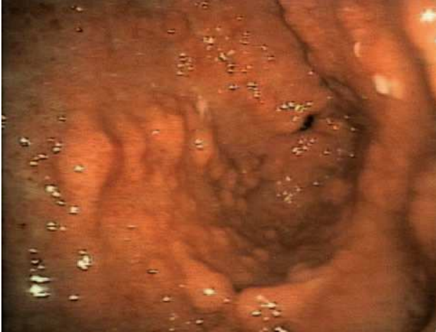
Fig. 1. Endoscopia oral.

mg/día), loratadina (10 mg/día), ciprofloxacino (500 mg/12 h) y suplementos con cinc. Posteriormente, se introdujeron corticoides por vía oral, reduciendo 4 mg de metilprednisolona cada semana y manteniendo el resto de la medicación. Se obtuvo una remisión clínica precoz y el paciente recuperó el sentido del gusto, el vello corporal y del cuero cabelludo y 14 kg de peso. Tras finalizar el tratamiento corticoideo, administrado durante un total de 10 semanas, se realizó al paciente una endoscopia oral, en la que se observó que la mayor parte de las lesiones polipoides gástricas y duodenales habían desaparecido. Persistía únicamente una mucosa gástrica nodular en la cara anterior del cuerpo gástrico. El paciente ha continuado tratándose con cromoglicato disódico, ranitidina y loratadina, y en la actualidad se mantiene en remisión clínica, 6 meses después del inicio del tratamiento.