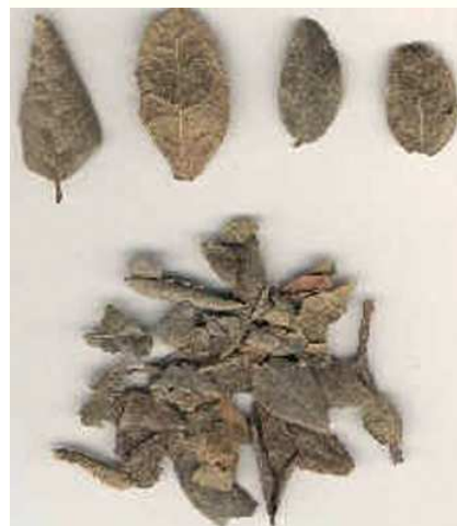
Fig. 3. Hojas de boldo

Actividad colerética. En rata se ha demostrado una actividad colerética importante, medida por la secreción de bilis, tras administración intraduodenal del extracto etanólico purificado (250 y 500 \text{mg/ml} ), del extracto etanólico bruto y de una infusión de ho-