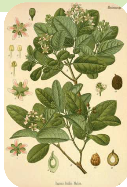
Fig. 2. Peumus boldus Molina

Actividad antioxidante. Estudios recientes, centrados en la búsqueda de antioxidantes naturales procedentes de plantas medicinales tradicionalmente utilizadas en el tratamiento de