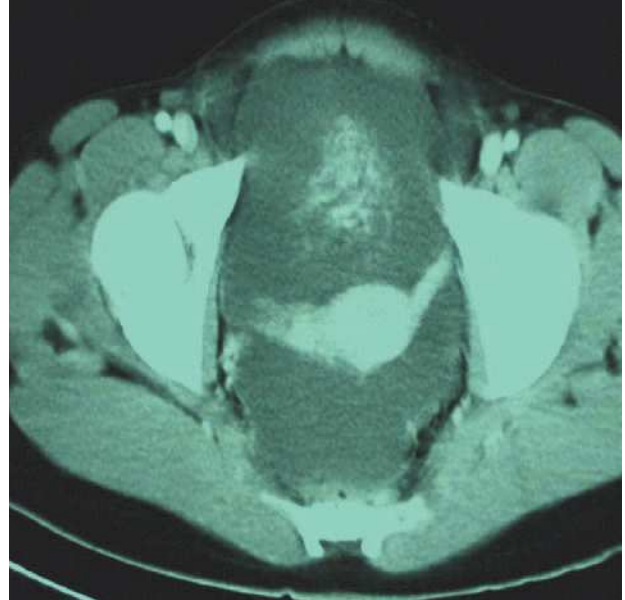
Figura 1. Tumoración pélvica.