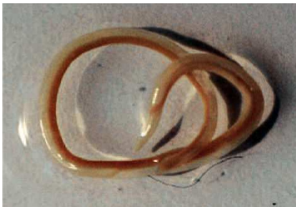
Figura 1. Larva de Anisakis simplex .

vivas que se enganchan a la mucosa gastrointestinal, la sintomatología está producida por la reacción inflamatoria y ocasionalmente por la penetración del parásito que puede invadir otros órganos.