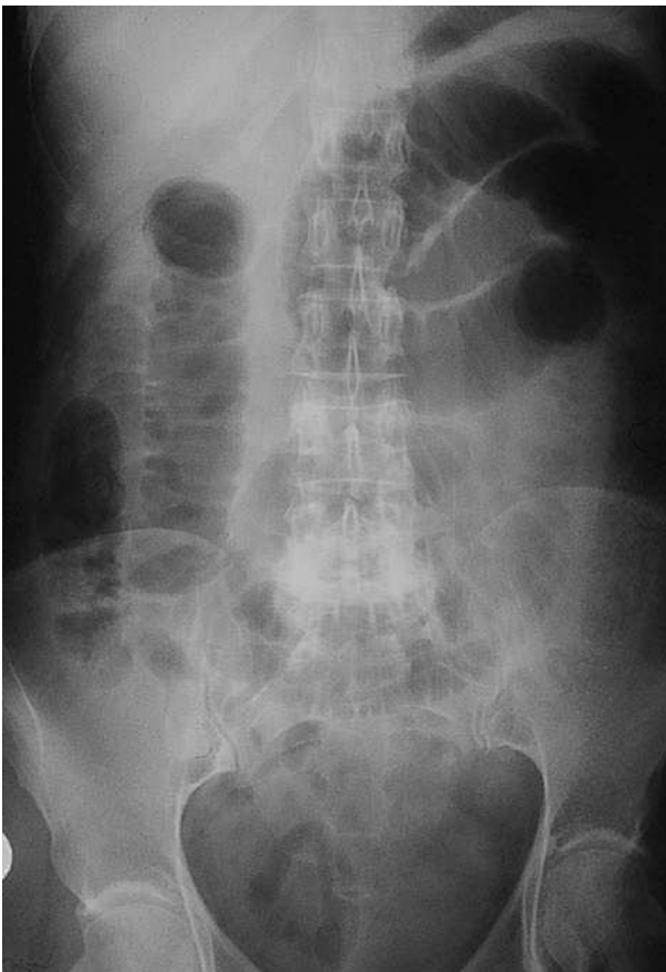
Figura 2. Radiografía simple de abdomen anteroposterior.

Mujer de 54 años, sin antecedentes de interés, que acude por presentar desde hace 2 días dolor en hemiabdomen superior tipo cólico acompañado de vómitos fecaloideos de 12 horas de evolución. Exploración física: afebril, destaca un abdomen doloroso, distendido y timpánico con aumento de los ruidos hidroaéreos, el resto sin hallazgos de interés. La analítica de sangre (hemograma, bioquímica básica y hemostasia) presenta una leucocitosis (12.900 leucocitos, 86,1% neutrófilos), el resto de los valores están dentro de la normalidad. Radiografía simple de abdomen (fig. 2): dilatación de las asas de intestino delgado y edema de pared. Radiografía en bipedestación (fig. 3): niveles hidroaéreos. Se realiza laparotomía exploradora ante el cuadro de obstrucción de intestino delgado, hallándose serositis segmentaria en yeyuno con restos larvarios de AS. Tras instaurar sueroterapia y dieta absoluta se produce una mejoría de su estado general en las siguientes 72 horas,