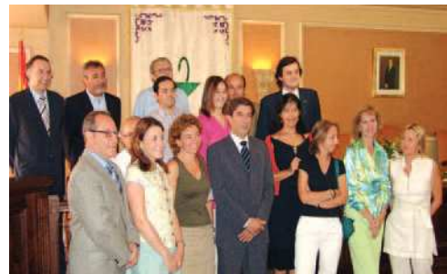
Nueva Junta de Gobierno del COF de las Islas Baleares

de la directora general de Farmacia señalando su intención de consolidar el proyecto que comenzó hace 4 años. Así, afirmó que tanto él como el resto de miembros de la Junta accedían a sus cargos «con la clara intención de trabajar, día a día, con esfuerzo y humildad, con rigor y con el máximo respeto por esta institución». Real confía en que «con el trabajo y el esfuerzo de todos seremos capaces de de-