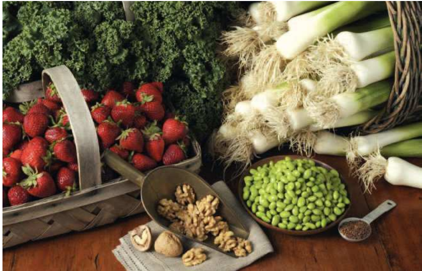
Incentivar buenos hábitos alimentarios en las personas mayores será el objetivo de Edufar 2005.

De ahí que esta iniciativa también esté encaminada a proporcionar al farmacéutico formación específica en esta materia (a qué se debe la mala nutrición en los mayores o las posibles repercusiones de esta defi-