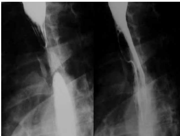
Fig. 1. Tránsito esofágico: defecto de repleción en el tercio superior esofágico.

En el caso que nos ocupa el hallazgo de la arteria aberrante se produjo de forma casual, dado que no habíamos sospechado el cuadro, puesto que nuestra paciente en ningún momento había presentado disfagia. No es infrecuente que haya pacientes con disfagia lusoria no diagnosticada, o bien que su diagnóstico se haga de forma incidental, debido a que una gran proporción de pacientes (60-70%) permanece asintomática durante toda su vida 3 . Habitualmente, y debido a que en pacientes con disfagia no