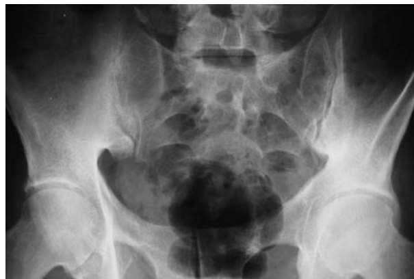
Figura 1. Imagen de radiología simple sin cambios significativos.

Ingresa por dolor lumbar y febrícula de 15 días de evolución. Dolor localizado en área glútea derecha, dificultad para la deambulación y respuesta insatisfactoria a analgésicos (metamizol y paracetamol). Los antiinflamatorios no esteroideos se sus-