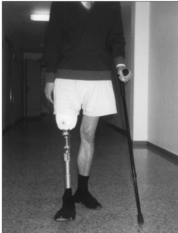
Fig. 11. Amputado femoral. Marcha con un solo bastón (proyección frontal anterior).