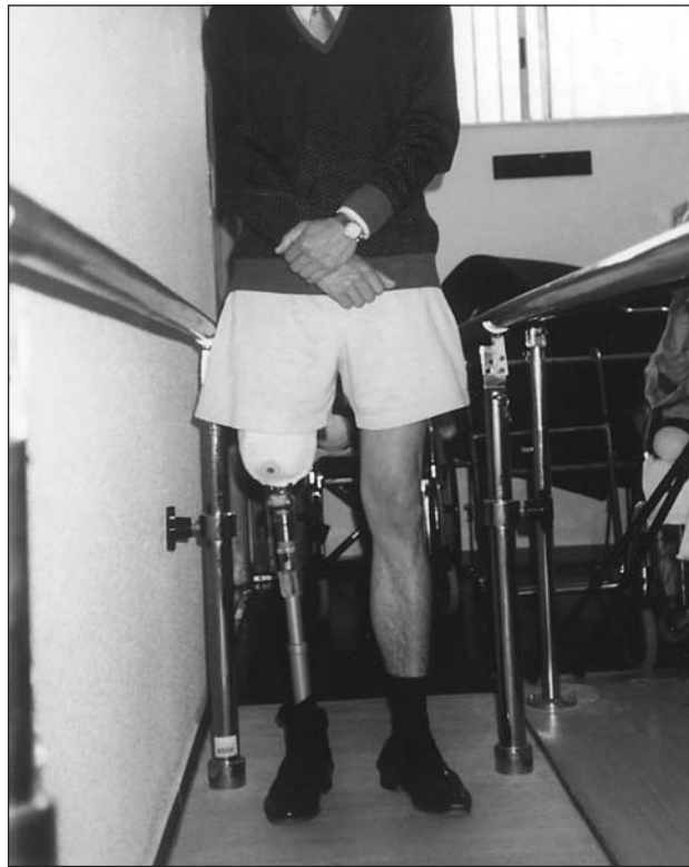
Fig. 7. Amputado femoral en carga estática.