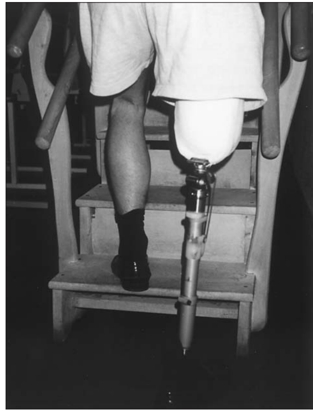
Fig. 12. Amputado femoral. Subida de escaleras (proyección frontal posterior).

Por último concluimos reseñando la escasez de publicaciones sobre sistemas o escalas de valoración funcional del amputado con prótesis de miembro inferior. Además el concepto de función y por tanto de éxito en el manejo de la misma no es unánime para todos los autores 11,15 , lo que ocasiona que los datos obtenidos en los distintos estudios, no sean comparables y por tanto difíciles de interpretar y correlacionar los resultados aportados por los mismos.