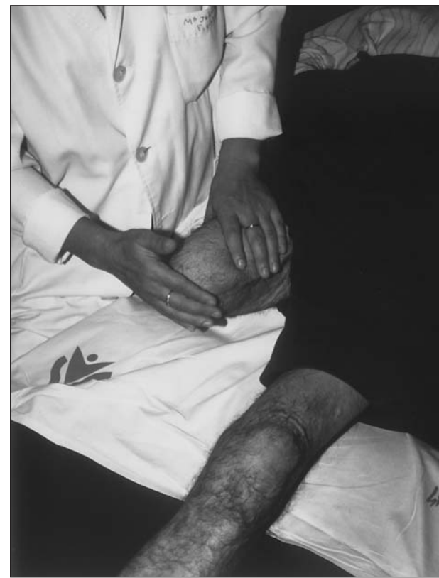
Fig. 1. Técnicas de desensibilización por masoterapia percutoria.

• Extensión del muñón con empuje anterior de la pelvis (fig. 2). El paciente en posición de decúbito supino; el muñón lo apoyó sobre un pequeño banco de 15 cm de altura o en sacos de arena. El miembro contralateral lo mantuvo flexionado sobre el pecho, para corregir la lordosis. Seguidamente, se pidió al paciente, que apoyase el muñón sobre el banquito haciendo a la vez una propulsión de la hemipelvis simulando la situación de puesta en carga con inicio de la base de balanceo de la pierna sana.