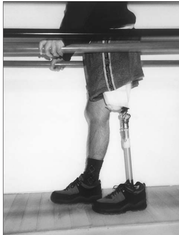
Fig. 10. Amputado femoral. Inicio de la fase balanceo, dentro de paralelas (proyección sagital).

la escasa utilización de la extensión del muslo que suelen realizar estos pacientes al utilizar de forma rutinaria los bastones compensando con los mismos la rotación pélvica y los cambios posicionales del centro de gravedad. Nos encontramos pues con solicitaciones musculares menores 21 y consecuentemente, con una disminución del trofismo de este músculo. Esto es especialmente importante, durante la subida de escaleras y rampas, lo que provoca que muchos amputados femorales, no puedan ejecutarlo 22,23 y que otros sufran caídas al intentarlo.