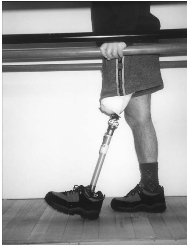
Fig. 9. Amputado femoral. Final de la fase balanceo, dentro de paralelas (proyección sagital).