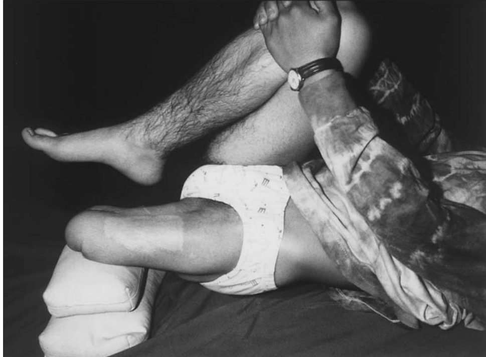
Fig. 2. Técnicas propioceptiva para extensión de cadera.