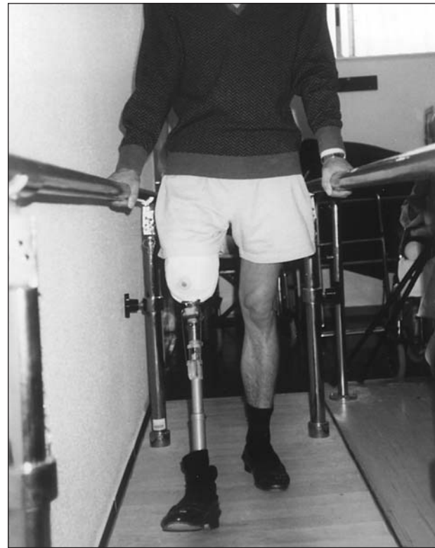
Fig. 8. Amputado femoral durante la marcha en paralelas (proyección frontal anterior).

lar y el resto fueron femorales de etiología traumática. El rango de edad presentado por estos pacientes, estuvo comprendido entre (30-45) años.