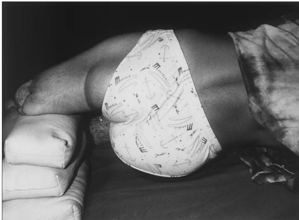
Fig. 3. Técnicas propioceptivas para adductores.