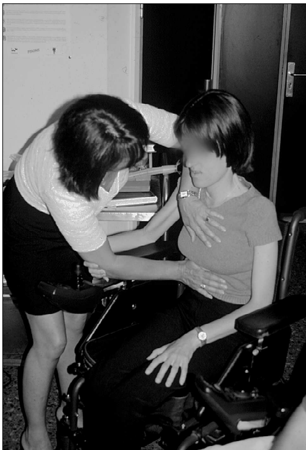
Fig. 5. Paciente asistida por su mamá con presión abdominal.

cesos infecciosos y en situaciones de atragantamiento. Cuando la aspiración se efectúa con catéter la aproximación de mucosidades es más selectiva en el árbol bronquial derecho y menos en el izquierdo por su posición y orientación anatómica. Por ello los procesos neumónicos específicos del pulmón izquierdo son mayores y entre el 54 y 92 % de las aspiraciones rutinarias con catéter no acceden al bronquio principal izquierdo; en cambio, cuando se utilizan exuflaciones con presiones negativas, las mucosidades se aspiran de ambos bronquios principales evitando tapones mucosos y atelectasias. La efectividad de la exuflación con presión negativa se hizo evidente cuando se eliminaban grandes