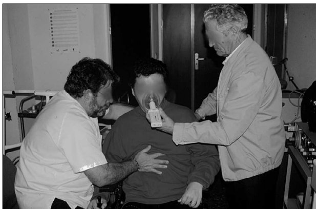
Fig. 2. Valoración del paciente.

encaminadas a suplir, en lo posible, la incapacidad de los músculos inspiratorios para conseguir una distensión toracopulmonar y de los músculos espiratorios, para generar flujos lo suficientemente efectivos para toser y evitar atelectasias y neumonías que suponen un grave peligro para la vida de los pacientes 45 .