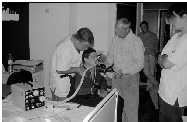
Fig. 4. Tos asistida con exufflator y presión torácica.