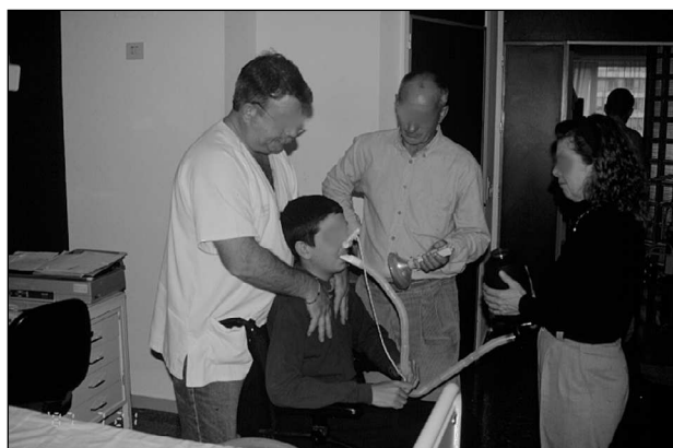
Fig. 3. Paciente al que se le asiste la tos con presión torácica tras MIC.

Con un ambú conectado a través de un tubo a una mascarilla nasal, oronasal o boquilla, sincronizando la insuflación de aire con la inspiración del paciente, intentamos escalonadamente llegar a la capacidad máxima de insuflación (MIC); que correspondería a la capacidad pulmonar total para que, desde este punto, el paciente realice una espiración máxima. Cuando es necesario, el fisioterapeuta presiona con sus manos el abdomen y/o tórax con el fin de generar flujos espiratorios elevados y así conseguir una tos efectiva. De esta forma se facilita la expectoración cuando el paciente lo precisa y se evita una retracción pulmonar, conservando la mejor distensibilidad pulmonar y torácica posible. Es necesario que exista una perfecta sincronización entre el fisioterapeuta y/o familiar que le asiste y el paciente. La coincidencia de apertura de la glotis con la maniobra de presión abdominal y/o torácica debe guardar la máxima precisión para conseguir los máximos flujos. Si la presión ejercida sobre el abdomen o tórax se realiza a destiempo los resultados nunca serán los esperados.