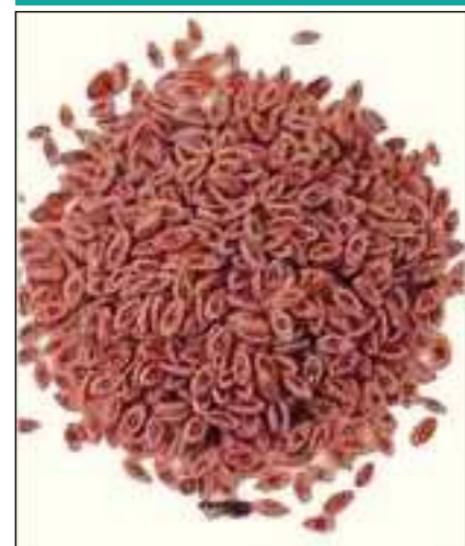
Fig. 2. Psyllii semen

Pero el efecto de los mucílagos en el intestino no parece ser únicamente mecánico. La flora anaeróbica intestinal produce la fermentación de los mucílagos en el colon distal, originando ácidos grasos de cadena corta (butirato, propionato, acetato) que se comportan como sustrato de los colonocitos y regulan la epitelización de la mucosa colónica, restituyendo así su integridad. Además, inhiben la producción de los mediadores proinflamatorios TNF \alpha y NO 5 . Ispágula puede también ayudar en la prevención de la carcinogénesis en el colon, propiedad que parece estar relacionada con su capacidad de inhibir, de forma significativa, la betaglucuronidasa bacteriana. Se ha demostrado experimentalmente que la elevación de la acti