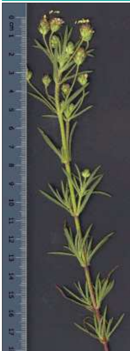
Fig. 1. P. afra L.

Como indica la Real Farmacopea en el caso de la ispágula, la droga oficial o parte empleada son las semillas y/o su cutícula seminal o tegumento, mientras que en las otras especies se utilizan las semillas.