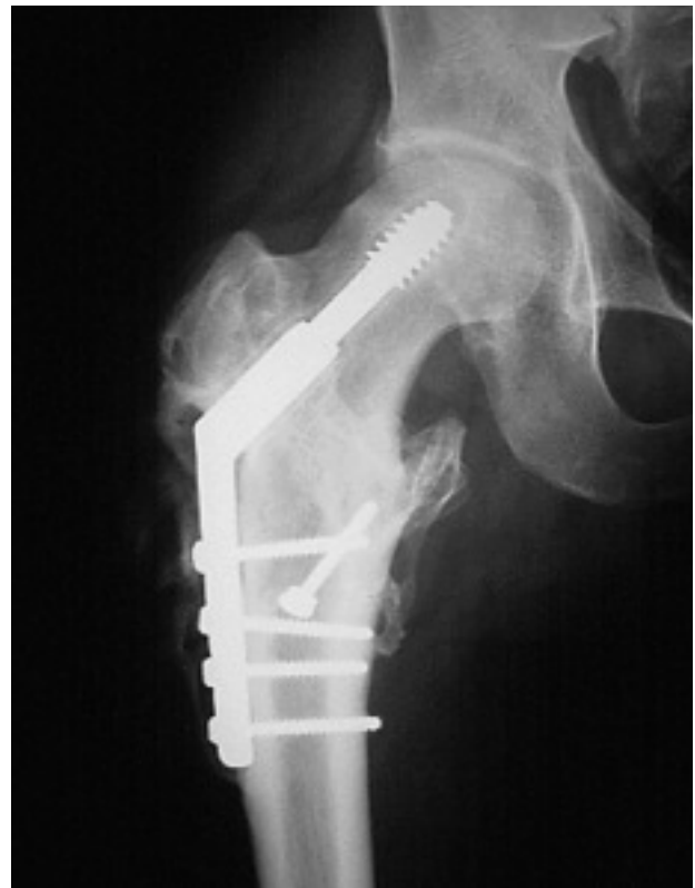
Figura 3. Clavo-placa deslizante tipo DHS (Dynamic Hip Screw).

Las desventajas de los tornillos-placa deslizantes son las de todos los métodos de síntesis extramedular, además de las económicas. En menos del 11% de los casos se producen pseudoartrosis u osteonecrosis 2 . Las complicaciones mecánicas de la técnica inciden en el 5%-6% de los casos, siendo el fallo más común la varización de la fractura y el corte a través del hueso osteoporótico cefálico 2,15,16,23,26,29-31 . Otros son la pérdida de reducción de la fractura (3%), fracturas de la cortical lateral del fémur (2%) y roturas y desmontajes de la osteosíntesis. El fracaso del implante se ha