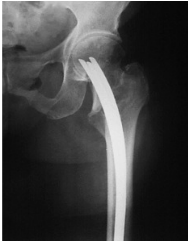
Figura 4. Enclavado endomedular elástico de Ender.

Enclavado endomedular elástico de Ender. En 1970, Ender y Simon-Weidner, siguiendo unos principios similares a los de Küntscher, describieron su experiencia en la fijación endomedular de fracturas trocantéreas y subtrocantéreas con clavos elásticos de un diámetro de 4,5 mm. La técnica consistía en la inserción de 4 o más clavos semielásticos a través del cóndilo femoral medial, continuando a lo largo de la diáfisis hasta ensartar el cuello y la cabeza femoral sin tener que abrir el foco de fractura 36 (fig. 4). Los clavos permitían impactaciones en el foco de fractura, y que ésta se estabilizara por sí misma, sin que fuera necesaria una reducción anatómica 36 . Por otra parte, los clavos repartían por igual las cargas a toda la diáfisis de forma progresiva 39 , y podían retroceder algunos milímetros y deslizarse a lo largo del cóndilo medial del fémur, evitando así la perforación de la cabeza femoral.