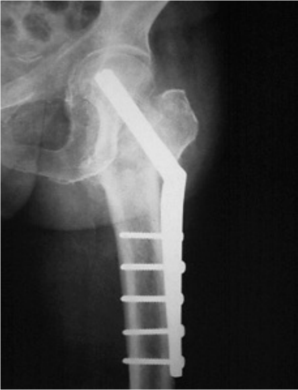
Figura 2. Clavo-placa de McLaughlin.

Las complicaciones de los clavos-placa incluyen hematomas postoperatorios (1,2%-3,6%), infecciones superficiales (1,7%-3,7%) y profundas (2,2%), fallos mecánicos graves (11%-25%), retardos de consolidación (1%) y pseudoartrosis (1%-3%), callos viciosos en varo, sobre todo en fracturas inestables, acortamientos (10%-23,5%) y, raramente, en rotación externa, dolor secuelar (en el 40% de los pacientes tratados con el clavo de McLaughlin), etc. 11,12,21,22,26 . Entre los fallos mecánicos de la osteosíntesis se incluyen los desmontajes (2,5% en el caso del clavo-placa de McLaughlin), las deformaciones y las roturas del clavo-placa (2,8%-10%), la rotura de los tornillos que sujetan la placa a la diáfisis, la protrusión del clavo a nivel trocántereo, las fracturas iterativas, etc. 12,21,26-28 .