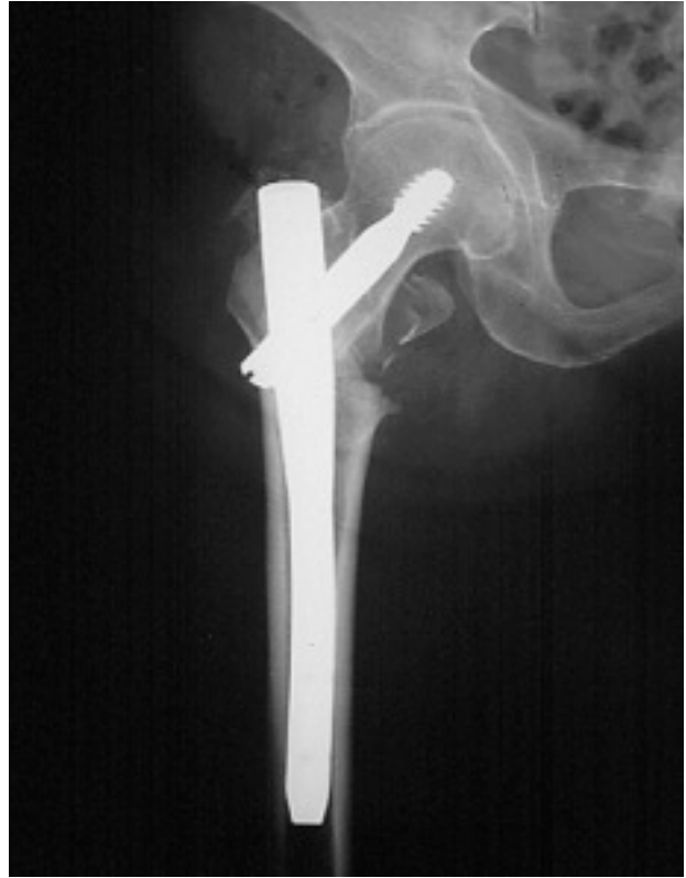
Figura 5. Clavo Gamma.

La correcta posición del tornillo cefálico en la parte media de la cabeza femoral es fundamental en la mecánica del montaje 49,50 . La tendencia espontánea a colocarlo en el cuadrante superior de la cabeza femoral, por encima del núcleo duro, facilita la varización del montaje con la carga, la protrusión acetabular del tornillo y hasta la fractura subcapital por fatiga. Los tornillos excesivamente cortos favorecen la varización secundaria de la fractura, mientras que los excesivamente largos protruirían en la articulación.