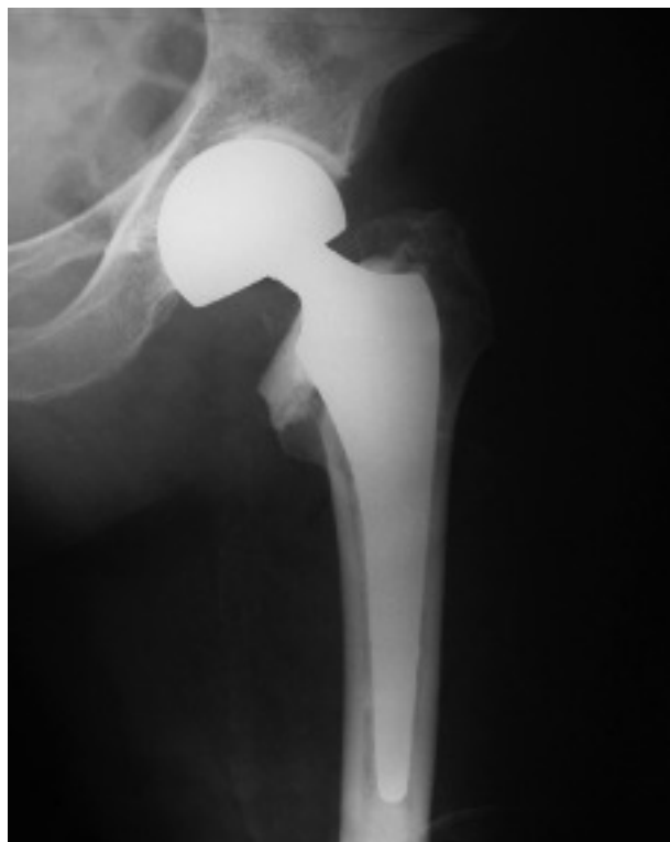
Figura 6. Prótesis parcial cementada en una fractura cervico-trocantérea de fémur.

Prótesis de cadera. Al igual que en las fracturas cervicales femorales, el tratamiento con prótesis de las fracturas trocantéreas ha sido propuesto por distintos autores con el argumento de la posibilidad del apoyo inmediato (fig. 6). La sustitución protésica en las fracturas de la región trocantérea es una intervención más compleja que una artroplastia convencional de la cadera y, por lo tanto, más peligrosa en el anciano 5,59 . Requiere una atenta planificación, resecciones óseas amplias, apertura de la cápsula articular, fijación del trocánter menor con cerclajes, utilización de cemento, etc. Las complicaciones incluyen un 5%-6% de fallos mecáni-