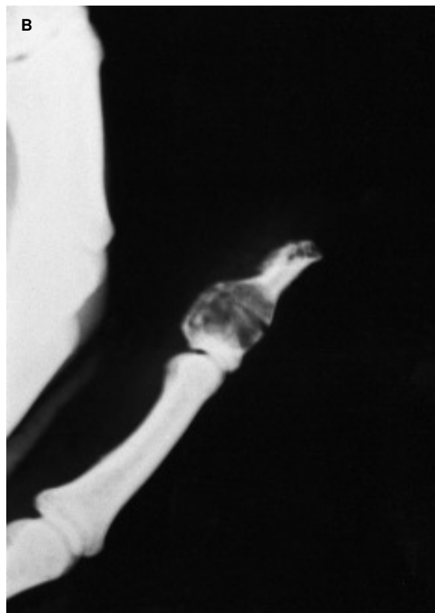
Figs. 2 A y B.—Radiografías anteroposterior y lateral en las que se aprecia la «osteotomía» transversal en la falange.