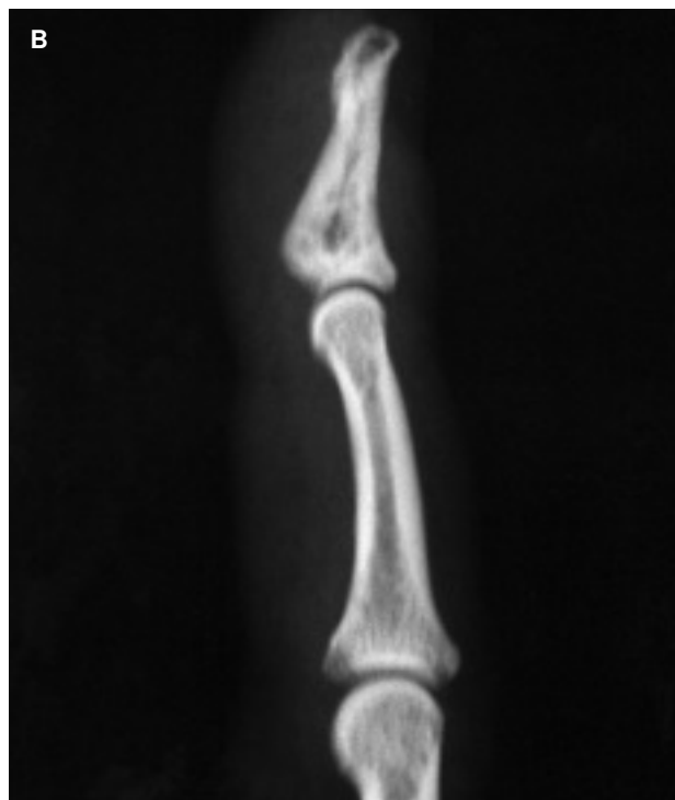
Figs. 3 A y B.—Radiografías anteroposterior y lateral a los 2 años de la intervención.