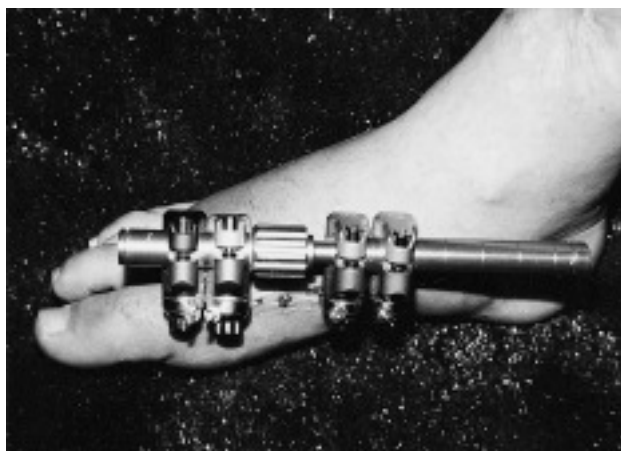
Fig. 2.—Se observa como han cicatrizado las partes blandas y el estado de la piel.