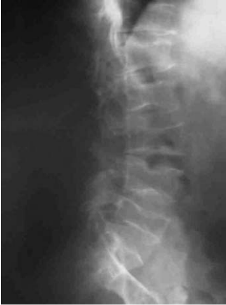
Fig. 5. Radiografía de columna lateral dorso-lumbar, en la que se observan varias deformidades vertebrales.

Clínicamente el paciente sufre una OI tipo III, con las manifestaciones características de la misma: a) aparición de fracturas ya desde la infancia; b) existencia de una baja estatura, y c) presencia de escleróticas azules en la infancia y adolescencia, aclarándose posteriormente en la etapa adulta, tal y como relata el paciente.