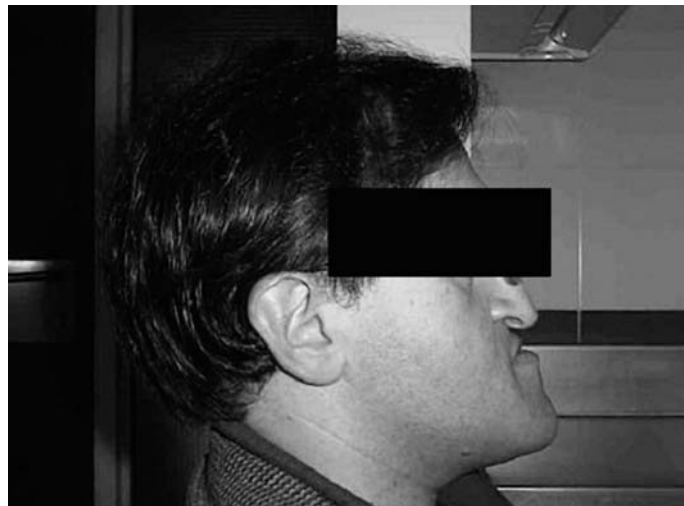
Fig. 3. Corrección de las fracturas maxilares.