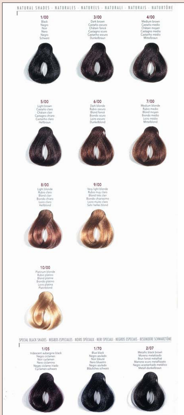
Fig. 3. Carta de colores. Tintes base

mechón de fibras que simulan cabello, se muestran los colores de los tintes base y de los tintes intermedios, así como las numeraciones que tienen en la escala de tonos (fig. 3). Conviene destacar que el mismo tono puede diferir ligeramente en las cartas de color de dos marcas distintas, y también que el resultado final de la aplicación de uno de estos tintes puede no ser idéntico al mostrado en las cartas de colores, ya que éstas muestran los resultados sobre fibras y no sobre cabello humano.