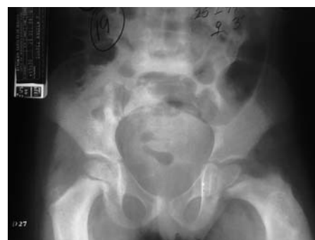
Fig. 2. Radiografía de pelvis. Se aprecia un patrón trabecular grueso con algo de protrusión acetabular.

Huesos largos (miembros superiores e inferiores): todos los huesos eran gruesos, cilíndricos con algún grado de convejeidad, trabeculaciones gruesas. En la cortical de los huesos se observaron bordes definidos y gruesos (fig. 3).