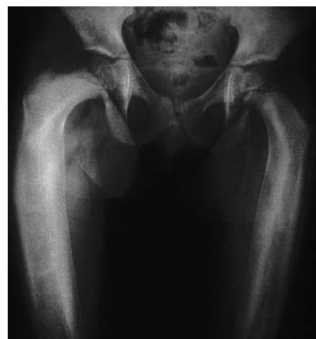
Fig. 3. Huesos largos (fémures, húmero y tercio proximal de antebrazo). Todos los huesos son gruesos, cilíndricos con algún grado de convejeidad, trabeculaciones gruesas. La cortical de los huesos se observa con bordes definidos y gruesos.

Manos: incremento de la densidad de los huesos de las manos con trabeculaciones gruesas (fig. 4).