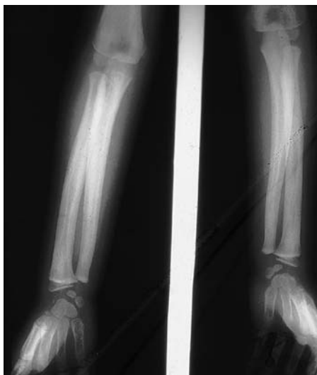
Fig. 4. Huesos largos de antebrazo y manos. Incremento de la densidad de los huesos con trabeculaciones gruesas. Convergencia de los huesos del antebrazo.

Con esta descripción radiológica, los niveles altos de fosfatasa alcalina permanente y la biopsia de glándulas paratiroides normales pensamos que se trata de un caso de hiperfosfatasa. Durante el mes de mayo de 2000, la paciente presentó nueva fractura del húmero derecho.