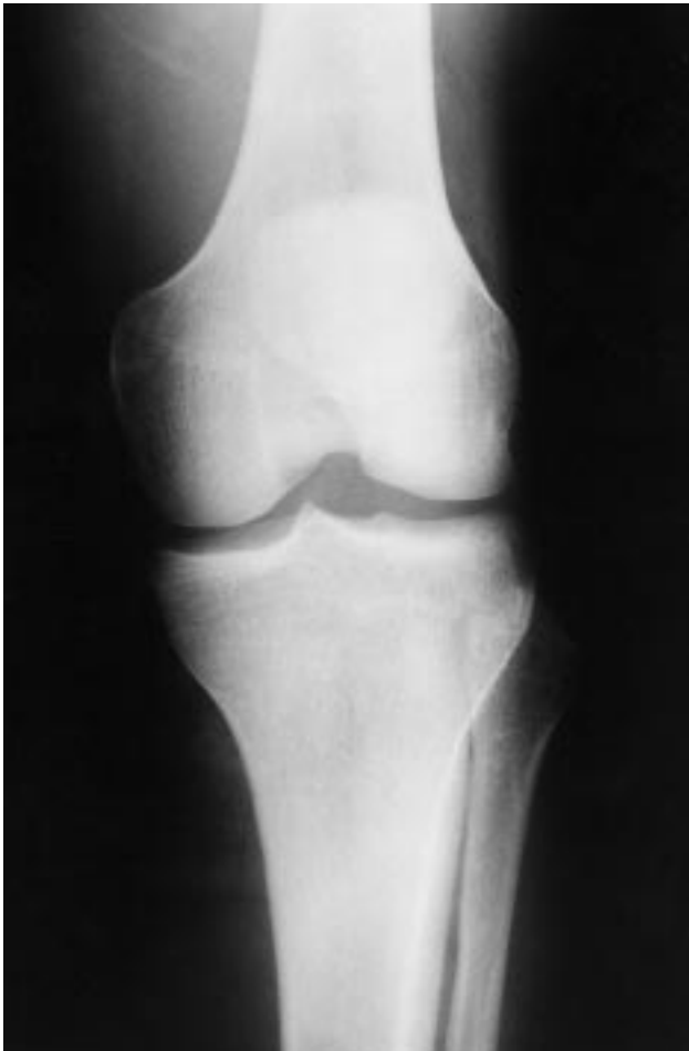
Fig. 3.—Radiografía anteroposterior de rodilla en la que se aprecia el resultado tras la reducción cerrada con una imagen correcta de la articulación.

Fig. 3.—Anteroposterior X-ray of the knee demonstrating the correct positioning of the joint after closed reduction.