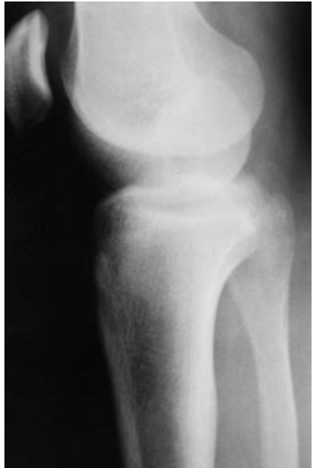
Fig. 4.—Radiografía lateral de rodilla. Se observa la misma reducción de la figura anterior.

Anatómicamente la articulación tibioperonea proximal consta de dos superficies articulares rodeadas de membrana sinovial y cápsula fibrosa. Tiene una estructura ligamentaria consistente. Anteriormente presenta el fuerte ligamento tibio-peroneo anterior, que se compone de tres bandas anchas y una extensión del tendón del bíceps. Y las estructuras posteriores aúnan al relativamente débil ligamento tibioperoneo posterior con una ban-