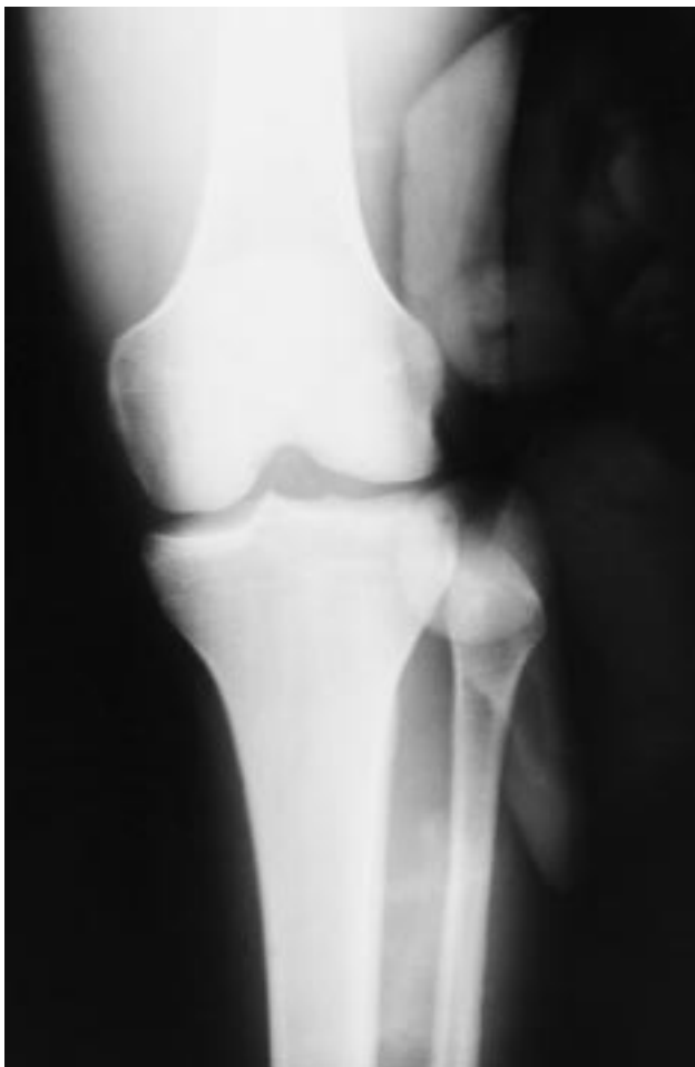
Fig. 1.—Radiografía anteroposterior de rodilla. Se observa desplazamiento anterolateral de la extremidad proximal del peroné.

La exploración radiológica simple era sugestiva de un despla-