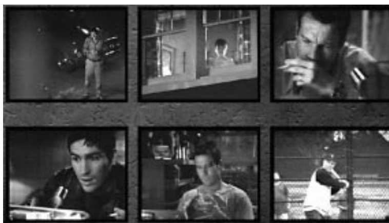
Figura 4. Fotogramas de Frequency , película en la que también el tabaco adquiere intencionadamente una mayor simbología, también en este caso a través del guión. Los ejemplos podrían multiplicarse hasta la saciedad. El padre —un héroe, un bombero— fuma constantemente; al ser avisado por su hijo desde el futuro que morirá de cáncer de pulmón, deja de fumar de golpe (¡ojalá fuera siempre así de fácil!), gozando en el último fotograma de la película —abuelo jugando con su nieto— de una gran salud. A la par, el hijo, con gran cantidad de problemas vitales y afectivos, fuma constantemente, asociándolo continuamente con estas circunstancias, sin plantearse dejarlo (a pesar del eficaz consejo dado a su padre).

Ante estas presiones, la OMS considera en primer lugar que el público debe ser consciente del problema: un buen diagnóstico facilita la solución. En segundo lugar, hay proyectos que proponen que cada película debería mostrar públicamente todas sus fuentes de financiación: no se trata de prohibir las donaciones o las subvenciones, pero sí se trata de que se hagan públicos los conflictos de interés, para que los espectadores puedan ser más críticos con los intereses ocultos de productoras, directores, guionistas o actores. En