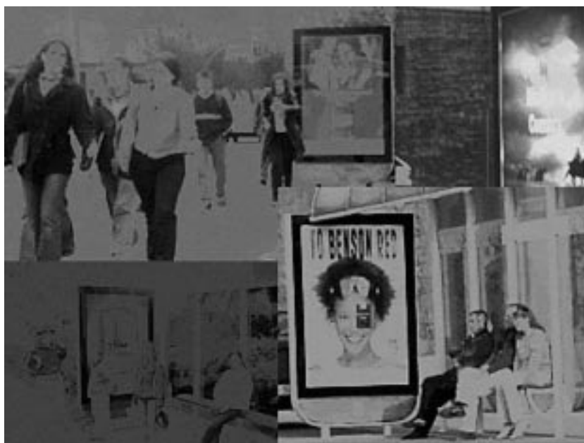
Figura 5. Ejemplos de anuncios a la salida de centros educativos de secundaria de la ciudad de Santander (2001-2003). Extrapolable a la mayor parte de las ciudades españolas.

En un estudio que hemos realizado en Santander, entre los años 2001 y 2003, en el que se han analizado las vallas publicitarias que hay cerca de la puerta de los centros de educaciones secundaria, se ha podido comprobado (fig. 5):