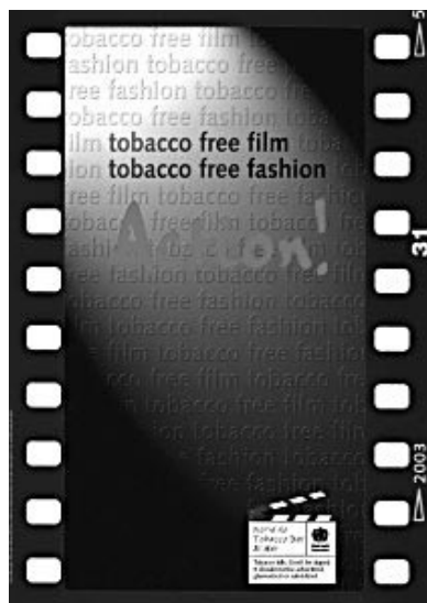
Figura 2. Cartel anunciador del Día Mundial sin Tabaco 2003.

La OMS se muestra preocupada porque este tipo de promoción indirecta puede mermar los esfuerzos que se están haciendo para controlar la difusión de la epidemia del tabaquismo, especialmente entre las po-