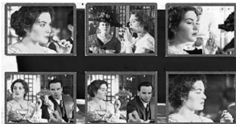
Figura 3. Fotogramas de Titanic , película en la que el tabaco adquiere intencionadamente una mayor simbología a través del guión. La protagonista abocada a un matrimonio de conveniencia se percata de que su vida será una cárcel y una gran fuente de infelicidad, no cuando le pegan o se burlan de ella o de su madre, o cuando ve alguno de los varios defectos de su prometido, sino cuando éste le impide fumar en su presencia (¡casualidad!).