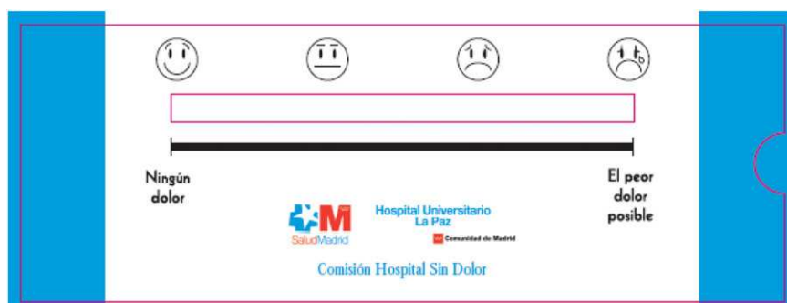
Figura 1 Escala de medición del dolor.