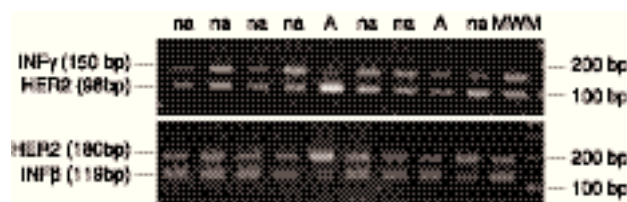
Fig. 2. PCR diferencial para la detección de la amplificación de c-erbB-2/HER2. na, no amplificado; A, amplificado; MWM, marcador de pesos moleculares.

los diferentes procedimientos empleados muestran los siguientes porcentajes. Cuando consideramos el grupo B con el clon CB11 como casos positivos junto con el grupo C, observamos unas concordancias del 41 % y