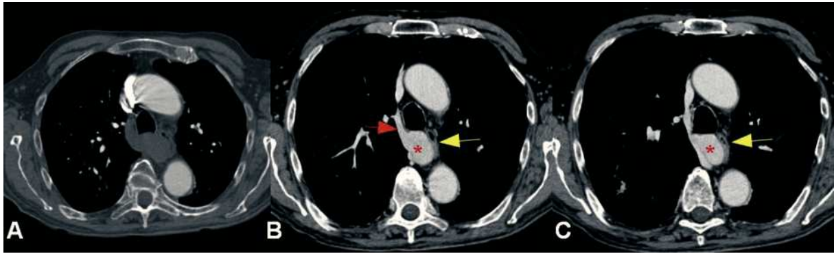
Figura 2 Angio-TC de arterias pulmonares. A. Imagen en el plano axial obtenida en la fase arterial precoz, donde únicamente se muestra tinción de la aorta ascendente y descendente. B y C. Imágenes en el plano axial en la fase tardía venosa donde se observa cómo la masa (asterisco) presenta una captación de contraste idéntica al resto de la vena ácigos (flecha roja), confirmandose que se trata de un aneurisma de la misma que comprime y desplaza discretamente al esófago (flecha amarilla). No se observan trombos en el interior del aneurisma.