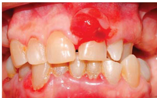
Figura 1. Vista frontal: periodontitis crónica generalizada y agrandamiento gingival a nivel de pieza 2.1.