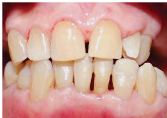
Figura 7. Reevaluación del estado de salud periodontal a los tres meses.