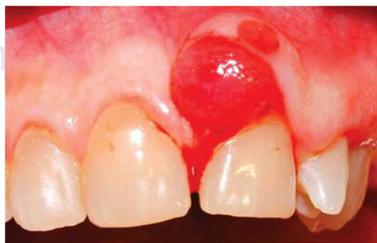
Figura 3. Vista frontal superior del agrandamiento gingival.