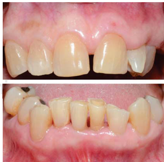
Figura 5. Vista frontal superior e inferior al mes. Resolución completa del agrandamiento gingival.

En esta reevaluación se encontró un porcentaje de bolsas de 5.5%, con profundidad de hasta 5 mm, presencia de movilidad grado 1 en los dientes anteroinferiores, ausencia de supuración y un índice de higiene