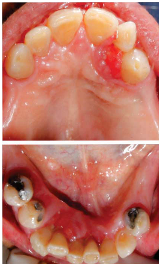
Figura 2. Vista oclusal superior e inferior.

Al examen intraoral se evidencia inflamación gingival en la mayoría de los dientes, también se observó una lesión de tejidos blandos en la encía marginal e insertada vestibular de la pieza 2.1 con presencia de supuración ( Figuras 1 a 3 ). Esta lesión se presenta como